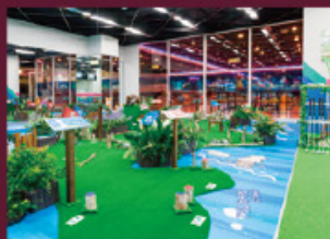
リリパットゴルフ