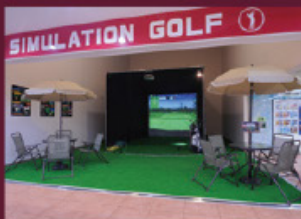
シミュレーションゴルフ

函館港が一望できる、見晴らしの良い最上階のレストラン「いちばん」では、北海道の食材にこだわった、函館名物満載の自慢の朝食をお楽しみください。焼ききたパンやご好評の目の前で焼く炭火焼きがご堪能いただけます。