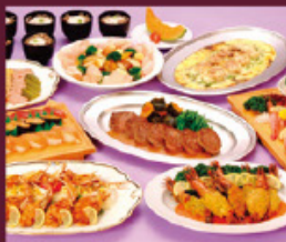
和洋コンビネーション