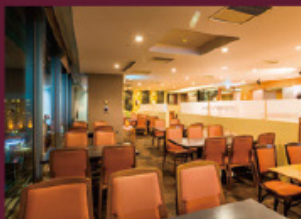
レストラン「いちばん」