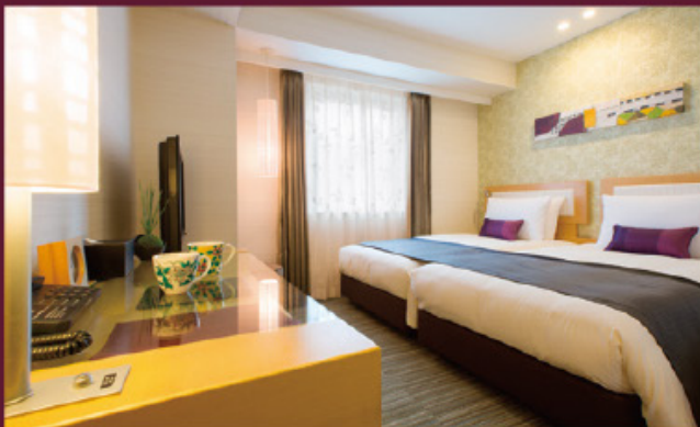
エコノミーツイン(悠久の光)