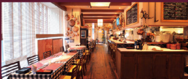
レストラン「イル・キャンティ」