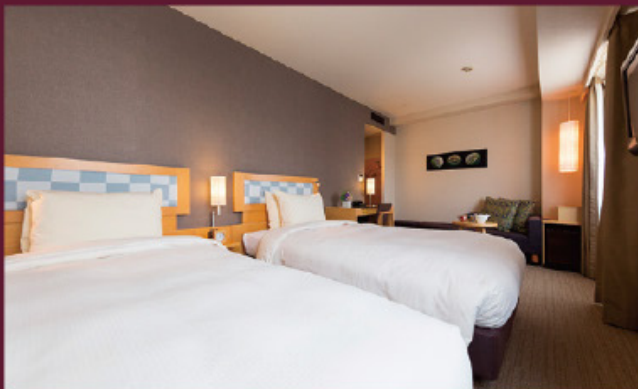
スタンダードツイン(能登の粹)