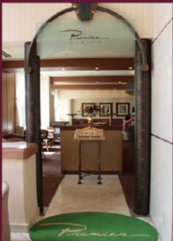
レストラン「プリミエール」