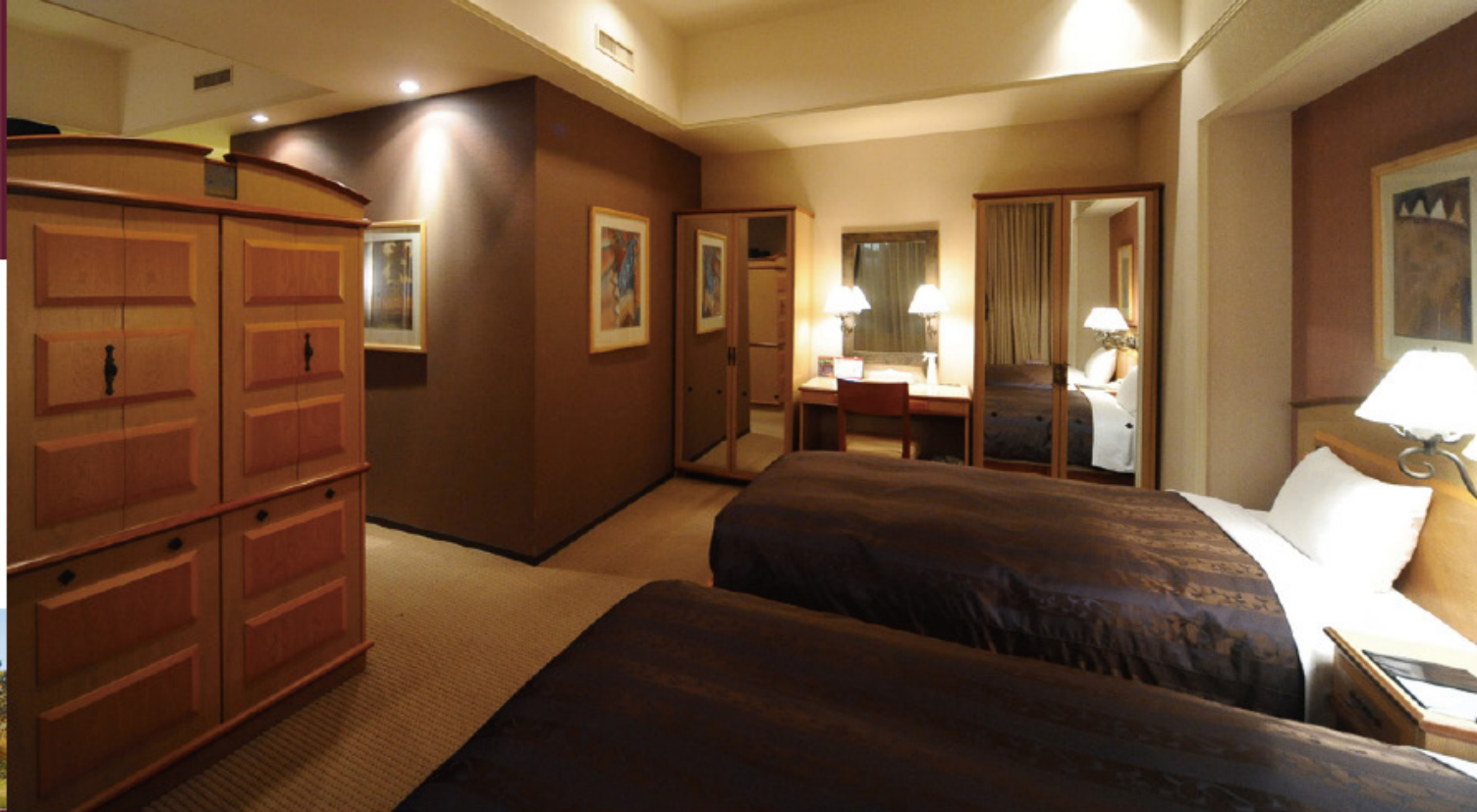
ジュニアスイートルーム