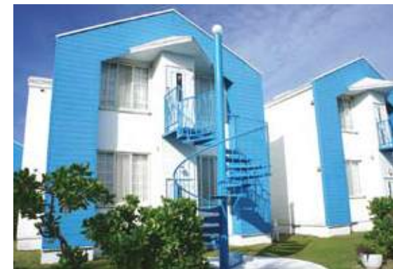
スタンダードコテージ