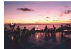
美しい夕日を眺めながらバーベキュー