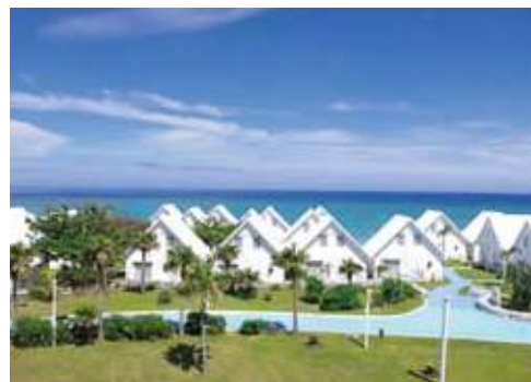
ファミリーコテージ

“東シナ海の真珠”と謳われたヨロン島は奄美群島の南端に位置し、沖縄本島の北約25kmに浮かぶ周囲22kmの小さな島。〈プリシアリゾートヨロン〉は島の西端、兼母海岸（＝サンセットビーチ）に面し、与論空港から車で5分という好立地。約5万㎡の広大な敷地内には、エーゲ海を想わせる白亜の各種付帯施設が充実しており、眼前には、エメラルド色に輝く美しい珊瑚礁の海と、白砂のビーチが広がっています。