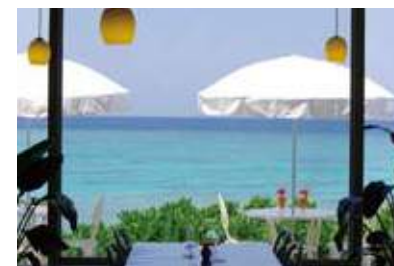
地中海レストラン「アネリア」

パブリックゾーンも多彩です。本館1階にレストラン、2階にはバンケットホール。海を見晴らすミコノス広場では、郷土色豊かな食事と新鮮な魚介類やオリジナルメニューが味わえる和風郷土料理レストラン「びき」、そして美しい夕日を眺めながら楽しめる地中海レストラン「アネリア」も人気です。そのほか、屋外プール、ホットタブ、テニスコート、教会、アロマラクゼーションサロン、シミュレーションゴルフなど。