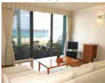
スーベリアデラックスルーム