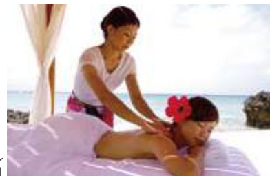
タラソ&アロマラクゼーションサロン「アエラキ」