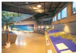
サザンクロスセンター