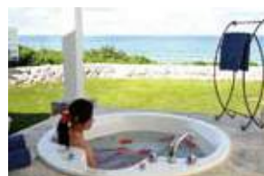
海を望むジャグジーバス