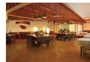
和風郷土料理レストラン「びき」