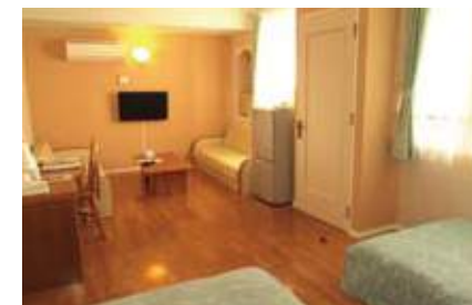
スタンダードコテージの室内