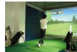
シミュレーションゴルフ「P's GOLF」