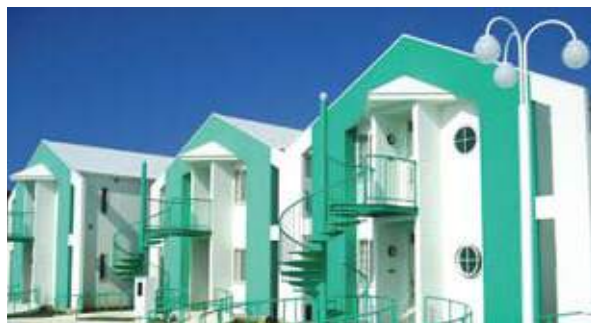
スーベリアコテージ