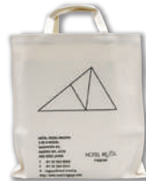
ホテルリソル名古屋オリジナル トートバック