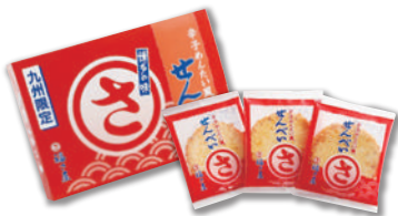
パリッと香ばしい海の幸の旨味が広がる 辛子めんたい風せんべい (1箱8枚入×4箱)