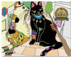
オリジナルブレンドコーヒー まほろブレンド・まちだ名産品