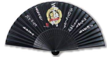
信長をイメージした 信長シルク扇子