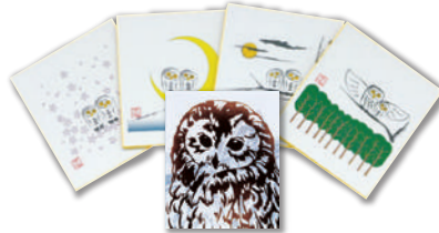
池袋のシンボル「ふくろう」 ふくろう手ぬぐいと色紙2枚セット