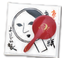
小さな手鏡とあぶらとり紙のセット よーじやセット