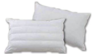
快眠をサポートするホテルオリジナルの枕 リソル佐世保オリジナルピロー 1個 (サイズ:H50×W70mm)