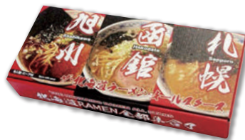
北海道を代表する醤油・味噌・塩ラーメンのセット 北海道ラーメンオールスターズ