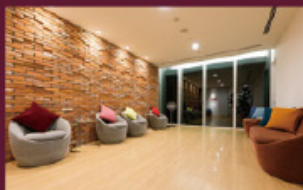
スパラウンジ(レディース)