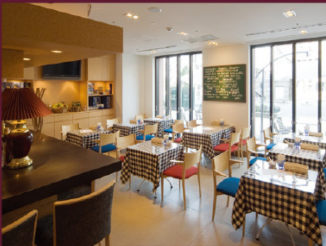
レストラン「イル・キャンティ」