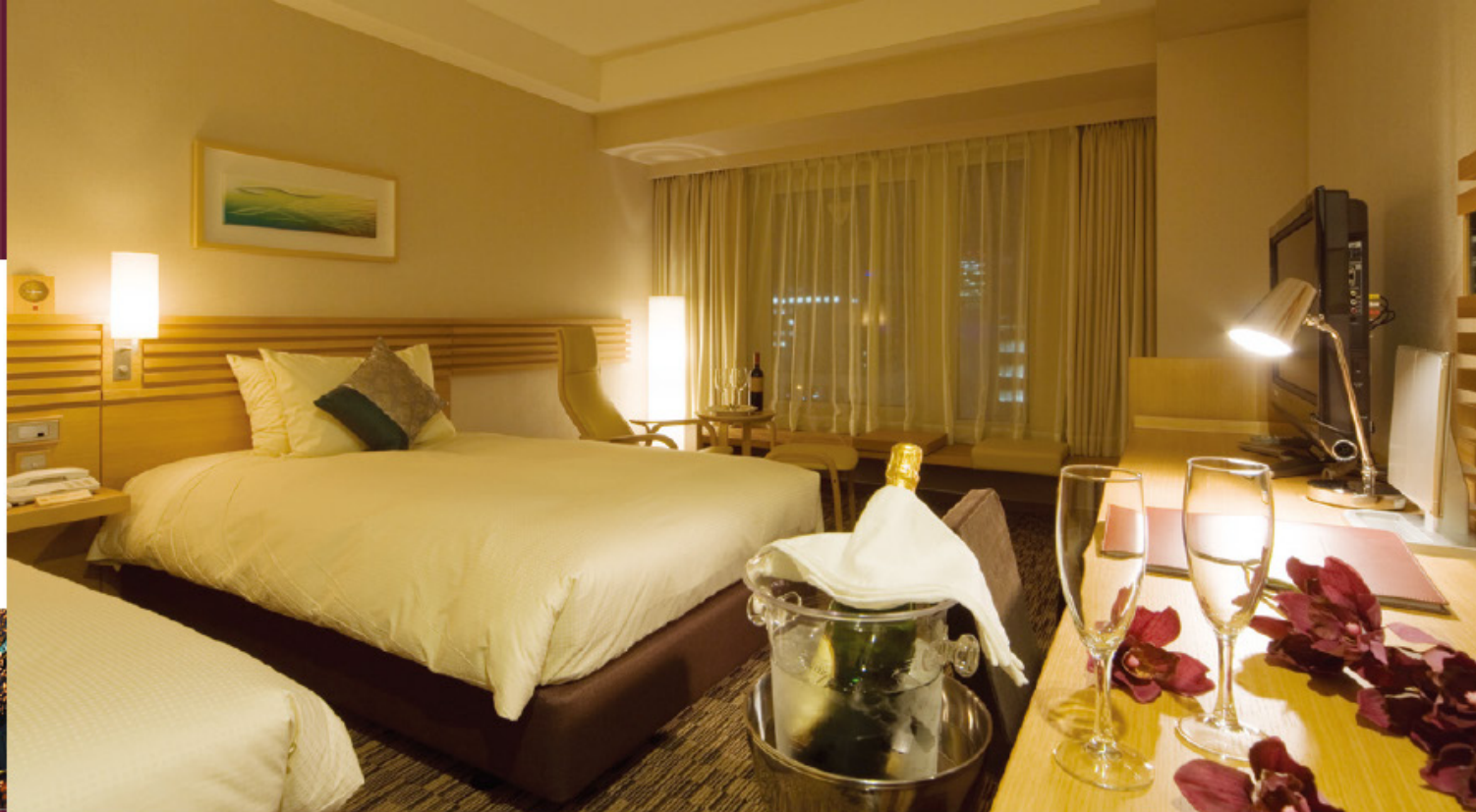
パークサイドツインルーム